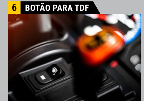
Botão TDF estacionário