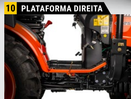
Plataforma completamente direita, sem túnel de transmissão