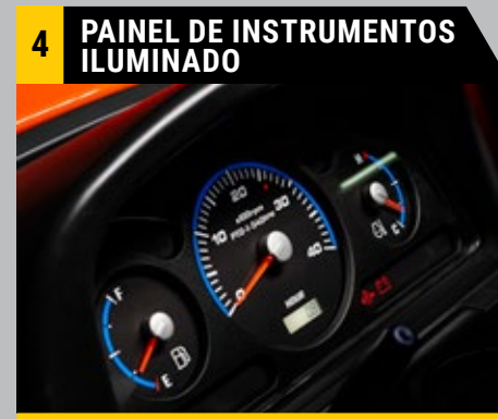
O painel de instrumentos ilumina-se quando o motor arranca para melhor visibilidade