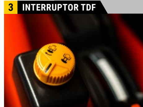
Acionamento eletrohidráulico da TDF