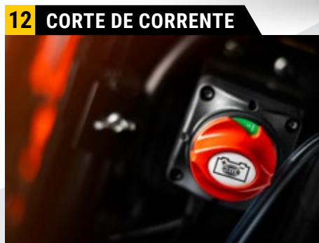
Total segurança com sistema de corte de corrente