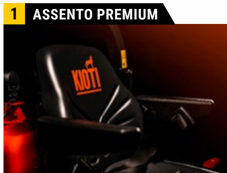
Assento com apoio duplo para os braços