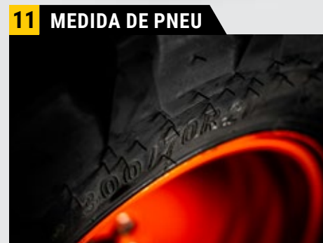
Pneu com dimensões 300/70R20