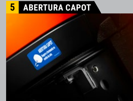
Abertura fácil do capot