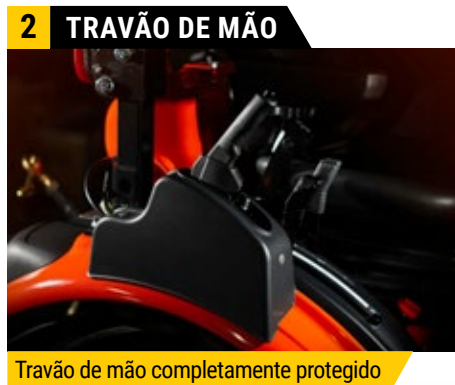
Travão de mão completamente protegido