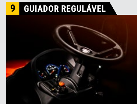
Ajustável por multiposição